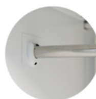
Patin de altura regulable