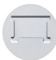
Patin de altura regulable